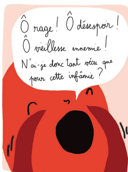
Verbale & Linguistique