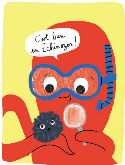
Naturaliste & Écologiste