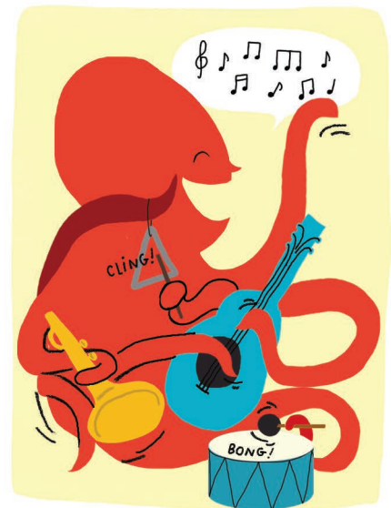
Musicale & Rythmique