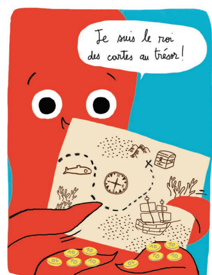
Visuelle & Spatiale